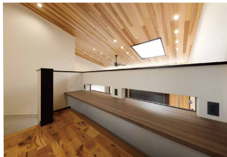
リビングと2階をつなげるスキップフロアスペース