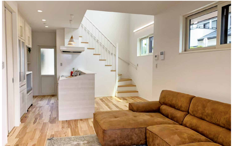
リビングのアクセントにエコカラットを使用し2Fホールには備え付け机完備