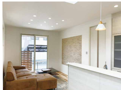
キッチン照明はブルートゥースピーカー内蔵